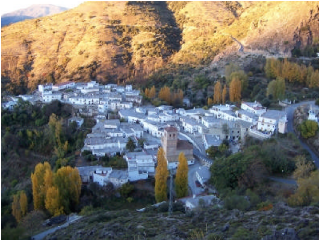
Vista del Barrio Bajo de Cástaras desde el Caminillo Viejo